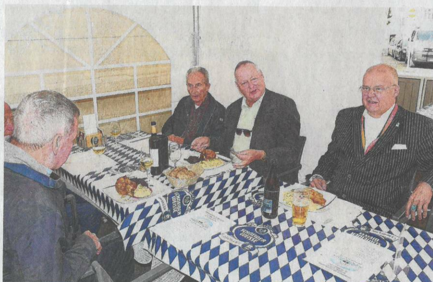
Hähnchenkeulen und Haxen am Liestaler Oktoberfest.