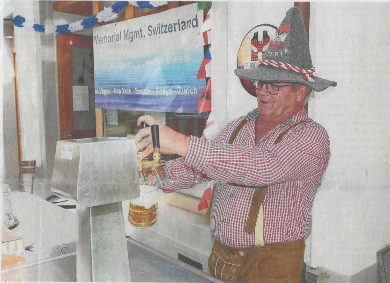
Hier wird gezapft.

Auch der Verein «Begegnungszone Liestal» war am letzten Wochenende in Lederhosen unterwegs und animierte das Publikum mit Wettbewerben und Preisen zum Verweilen im Stedtl. Für nächstes Jahr wurden weitere Aktionen zur Belebung der Kantonshauptstadt angekündigt. Weitere Bilder: www.pressestimm.ch > Kultur