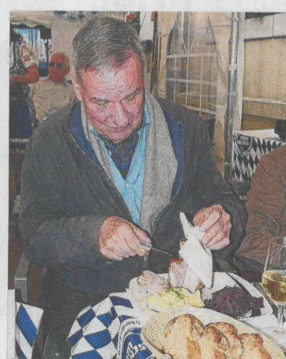
Mit dem Militärmesser wird der Haxen zerlegt.